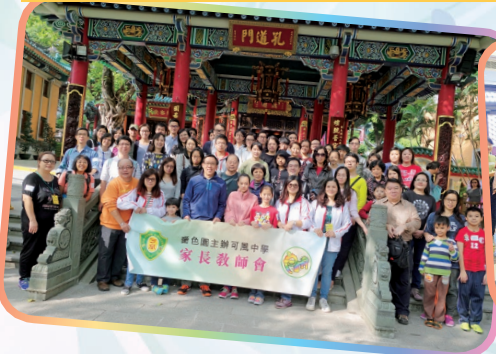
參觀太歲元辰殿暨會員聯歡會