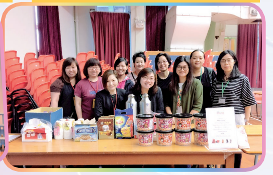
步步糕昇傳耆康親子活動